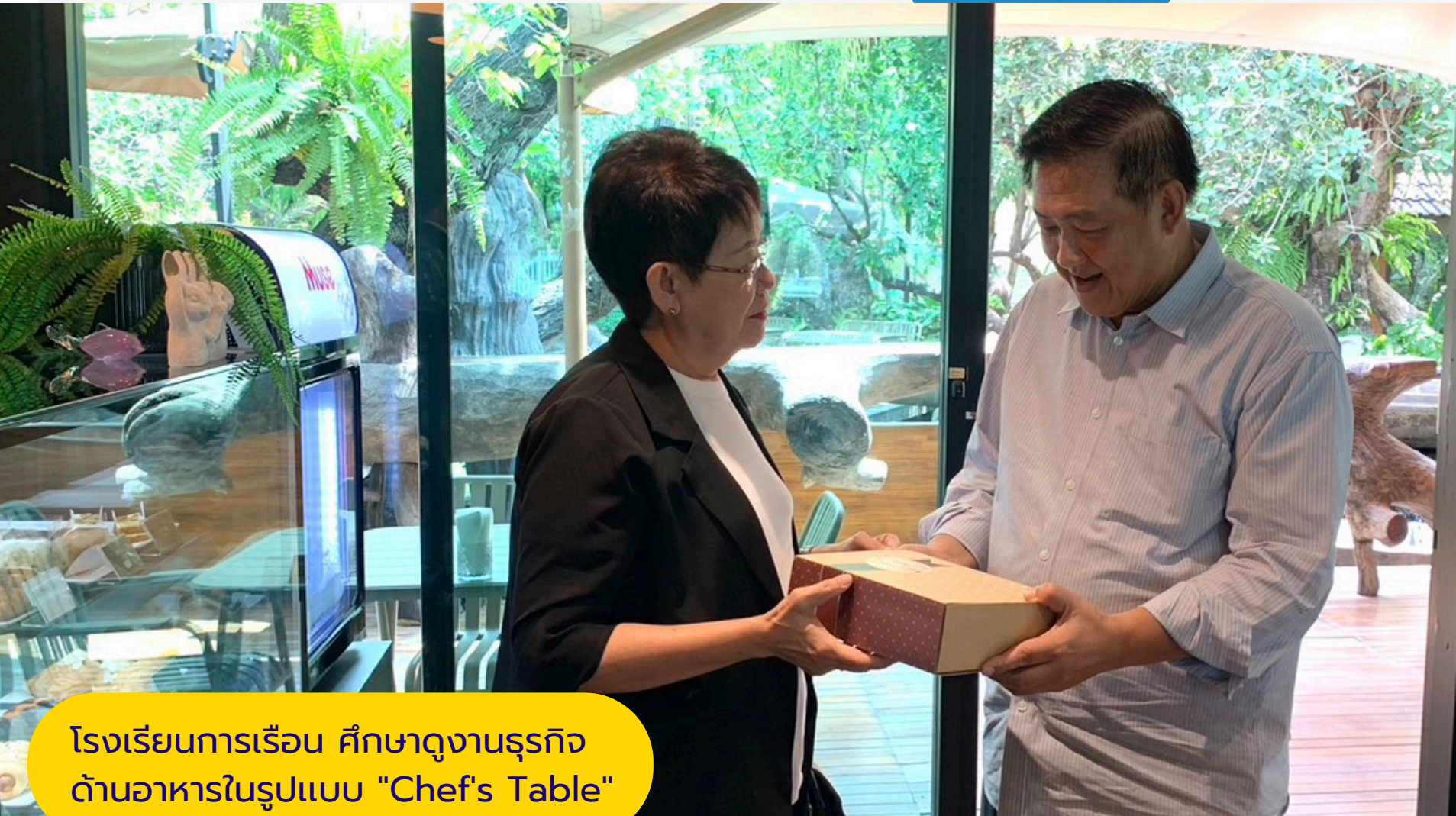
โรงเรียนการเรือน ศึกษางานธุรกิจ ด้านอาหารในรูปแบบ "Chef's Table"