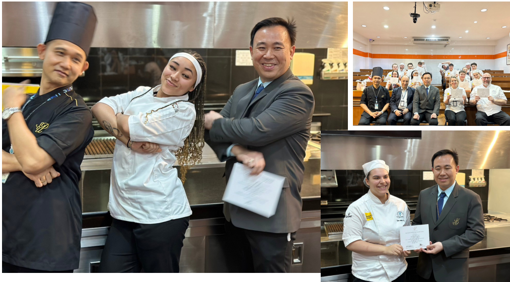
คณบดีโรงเรียนการเรือน มอวุดุมิบัตร ให้กับอาจารย์และนักเรียน ที่เข้าร่วมโครงการเผยแพร่ความรู้และวัฒนธรรมอาหารสู่สากล 2/2567 ภายใต้โครงการ LONDON-BANGKOK WORLD CITY LINKS 2024