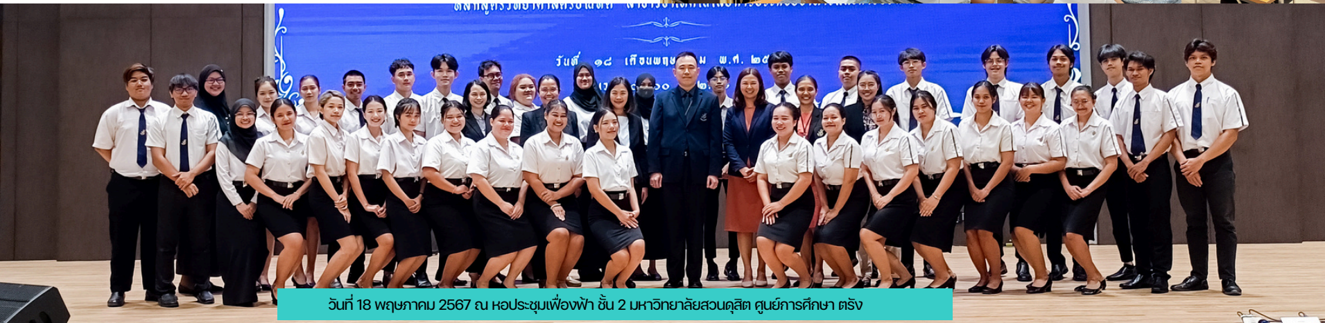
วันที่ 18 พฤษภาคม 2567 ณ หอประชุมเฟื่องฟ้า ชั้น 2 มหาวิทยาลัยสวนดุสิต ศูนย์การศึกษา ตรัง