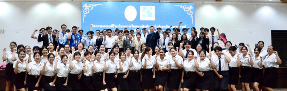
วันที่ 16 พฤษภาคม 2567 หอประชุม ชั้น 2 มหาวิทยาลัยสวนดุสิต ศูนย์การศึกษา ลำปาง