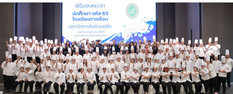
พร้อมหมวก นักศึกษา รหัส 63 โรงเรียนการเรือน มหาวิทยาลัยสวนดุสิต วันที่ 14 พฤษภาคม 2567 ณ ห้องประชุมรัตนกนิษฐ ชั้น 2